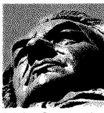
Webnamen: Thomaskantor Johann Sebastian Bach