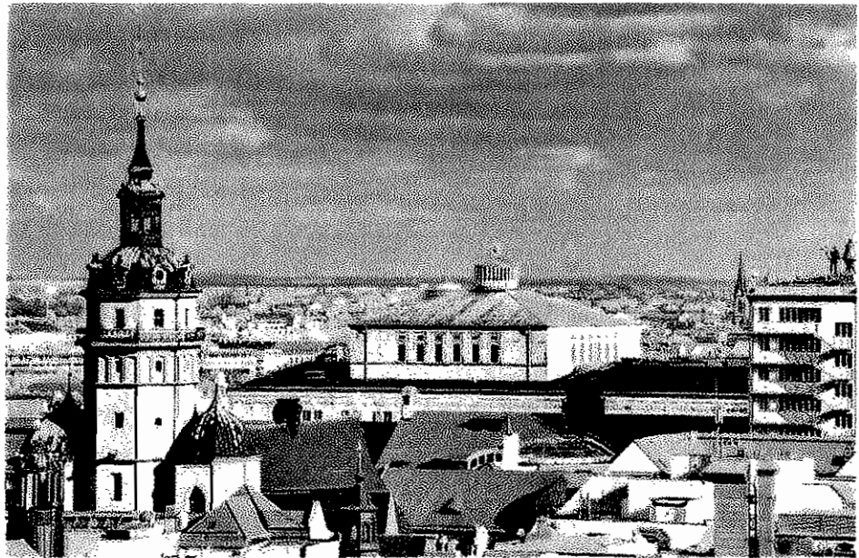
Musikstadt, Messestadt, Stadt der Wissenschaft - Leipzig hat viele Attribute und Anziehungspunkte, wie auch jener Teil der markanten Skyline mit Nikolaikirche, Opernhaus und Krochhaus auf unserem Foto zeigt

© Alle Dresdner Argumente finden Sie unter www.lvz-online.de.